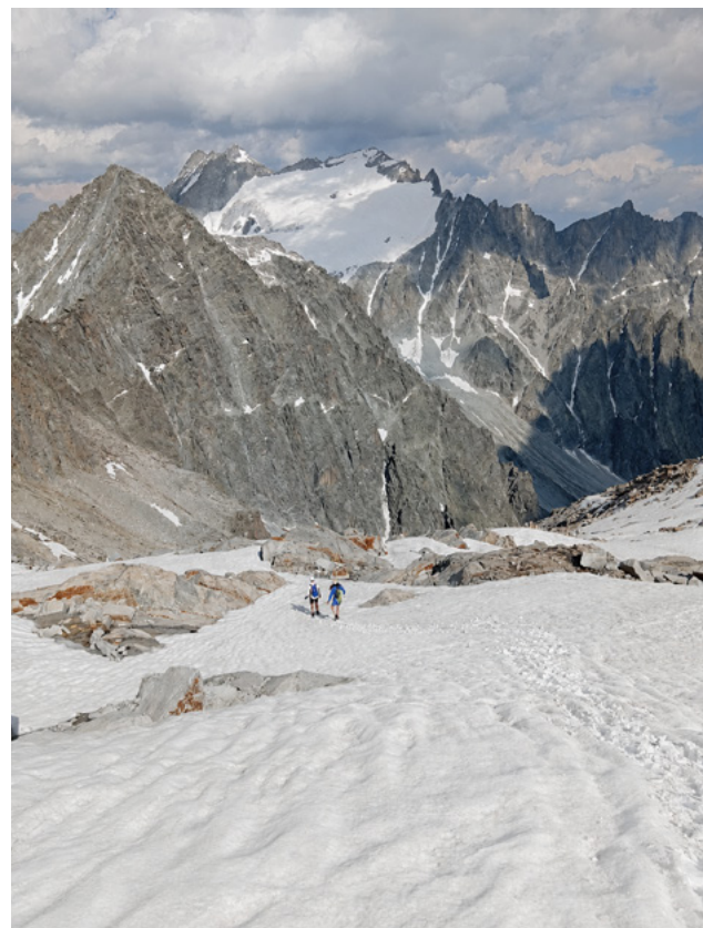
Satya gleicht der Besteigung eines hohen Berges. Der Weg verlangt Ausdauer, Mut und die Bereitschaft, sich für ein größeres Ziel einzusetzen.

Die Verlebendigung und lebensnahe Perspektive von Satya stellen aber für den strebenden Schüler des Yoga eine recht große Anforderung dar, denn sie sind nicht nur mit der Befolgung einiger kleiner menschlicher Gebote verknüpft, sie setzen vielmehr eine riesige schöpferische Aktion des mutigen Bewusstseins, das auf unbeschreibbare Höhen klettern will, voraus. Die Wahrheit (Satya) ist wie ein Berg, ein Himalaya-Riese, den der Schüler besteigen möchte und dabei schwierige Witterungsverhältnisse und angstschauendernde Hindernisse kalkulieren muss.