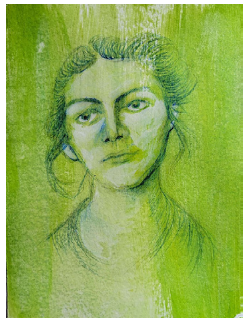
Die Physiognomie der Venus. In den Teilen, in denen die Physiognomie wirklich ausgeprägt ist, ist der Mensch tatsächlich authentisch und wahr.

Praktisch gesehen kann deshalb der Punkt „Satya“, die Wahrhaftigkeit, am Lebenswerk eine Maßeinheit gewinnen. Die Seele will ein Teil mit authentischer Beziehung zum Lebenswerk sein, und deshalb bildet diese Beziehung eine praktische Grundlage zu Satya. Jeder, der meditiert, kann deshalb die Erfolge der Meditation im Sinne von geistiger Erfahrung und Erkenntnissen werten und gleichzeitig seine weiteren Leistungen beobachten, die er gegenüber den Mitmenschen und der gesamten Weltenschöpfung entwickelt. Diese Form der Selbstbeschauung ist logisch, da sie die Entwicklung fördert und den Menschen im Herzen stärkt.