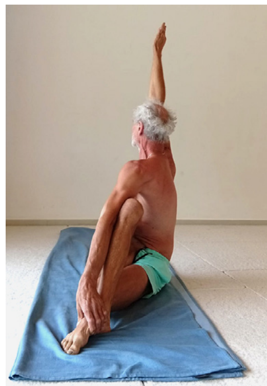
paripūrṇa-matsyendrāsana – der vollständige Drehsitz