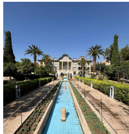
Haus in Shiraz, der Hauptstadt der Provinz Fars im Südwesten des Landes.

Siehe auch den Artikel, Krieg und Gewalt vom 02.01.2024