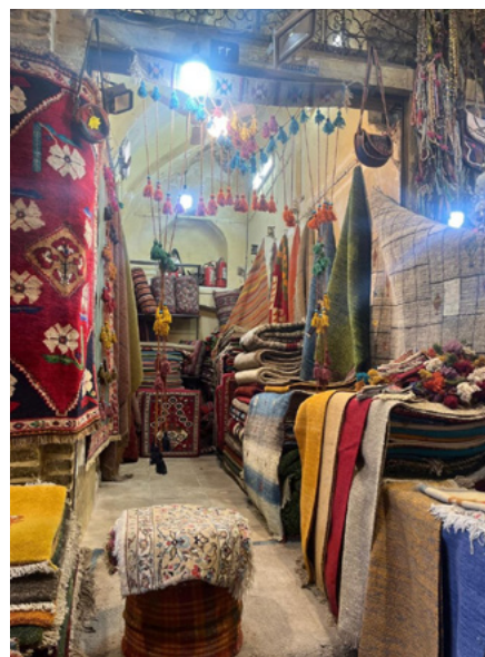
Bazar in Shiraz