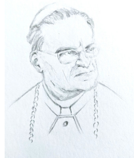
Kardinal Julius Döpfner. Zu Lebzeiten war er als große Kapazität unter Priestern bekannt.

Eine Kulthandlung kann wohl von verschiedener Seite aus eine Betrachtung erhalten, beispielsweise von der Freude und Anteilnahme an der rituellen Zeremonie, die der Priester oder Lehrer vollbringt. Menschen, die durch eine Weihehandlung zusammenkommen, verbinden sich in der Regel durch das gemeinsame Bekenntnis und weiterhin durch die Versammlung an einem religiösen Ort ihrer besonderen Wahl. Relativ schwer ist die Einschätzung des Wertes der Kulthandlung nach der Wahl der Worte und der andächtigen Stimmungen, die sich im Raume verströmen. Eine der letzten Personen, die mir in Kulthandlungen begegnet sind und die eine Wirksamkeit unmittelbar in das Sakrament legen konnte, war der längst verstorbene Erzbischof Julius Kardinal Döpfner. Er vollzog nicht nur das Sakrament für Firmanten und andere, sondern konnte auch einen Hauch eines Christusverständnisses leise in sein Ritual durch langjährige Erfahrung und evangelische Kenntnis hineinführen. Aber dieser sehr intelligente fromme Mann, klein von Wuchs, der als Kapazität unter den Priestern galt, verströmte diese feine Stimmung der Andacht nicht nur in den Weihehandlungen, sondern in seinen gesamten anderweitigen Lebensformen.