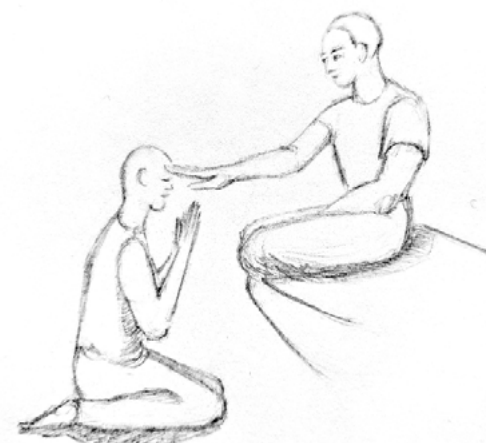
Die Mantraeinweihung vom Lehrer zum Schüler

Die Transsubstantiation bildet das Kernstück der Wandlung. Heute besitzt die Eucharistiefeier mehr symbolischen Wert, denn die Verwandlung der Materie bedarf nicht nur Gebete und Zeremonien, sondern einer vollkommenen Verwandlung des Menschen in all seinen Bewusstseinsverhältnissen.