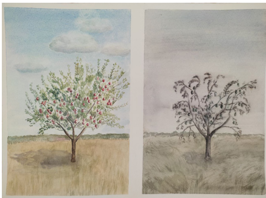
Zeichnungen des guten und schlechten Baumes von Anne-Michèle Hambye

Hütet euch vor den falschen Propheten, die in Schafskleidern zu euch kommen! Inwendig aber sind sie reißende Wölfe. An ihren Früchten werdet ihr sie erkennen. Liest man etwa von Dornen Trauben oder von Disteln Feigen? So bringt jeder gute Baum gute Früchte, aber der faule Baum bringt schlechte Früchte. Ein guter Baum kann nicht schlechte Früchte bringen, noch (kann) ein fauler Baum gute Früchte bringen. Jeder Baum, der nicht gute Frucht bringt, wird abgehauen und ins Feuer geworfen. Deshalb, an ihren Früchten werdet ihr sie erkennen. (Mt 7,15-20) 1) 2)