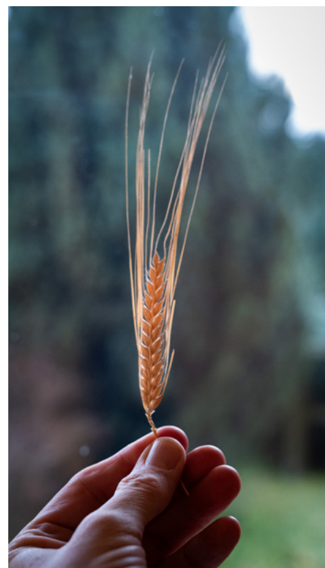
Elegante Lichtaktivität der Gerstenähre. Während der Tage über Neujahr wurde spezifisch dieses Getreide meditativ be- trachtet und in der Küche unterschiedlich künstlerisch ausgearbeitet.

Für den Geistes Schüler aber sind die selbstgeschaffenen Wahrheitsgefühle die größten Feinde. Sie werden sich mächtig auftürmen, ihm scheinbar ein rechtes Wirklichkeitswahrnehmen spiegeln und ihn doch haltlos in die Irre führen. Viele werden es vorziehen, auf ihren Lehrer zu projizieren, denn es ist leichter, einen Schuldigen zu benennen, als sich selbst und seine eigenen Gefühlsillusionen infrage zu stellen. „Dienen“ wird