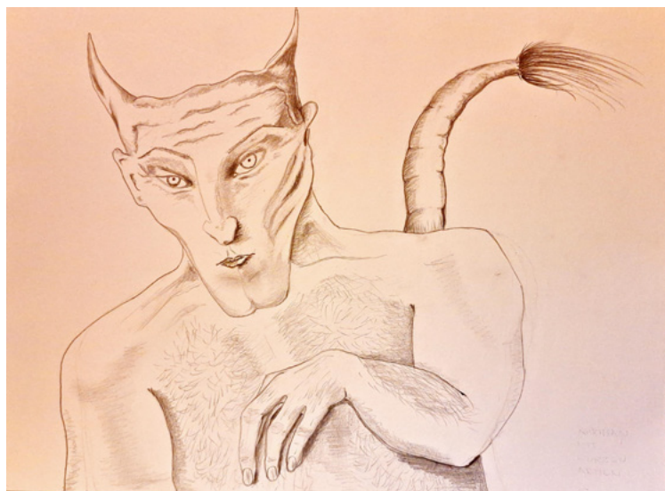
Künstlerische Darstellung von Ahriman Zeichnung von Christina Klus

Wenn jemand in seiner inneren Motivation Gewalt trägt, so wird diese sich im Umfeld dort, wo sich die Person aufhält, zeigen. Zwei Pferde rennen gewaltsam derartig aneinander, sodass eines dieser beiden stirbt. Im Hintergrund befindet sich eine Person, die diese Gewalt in tiefstem Willen trägt, und somit gibt es in ihrer Umgebung immer Bilder, die diese Gewalt offenbaren. Wenn jemand eine Einrichtung besucht und diese daraufhin unmittelbar günstige Entwicklungsschritte hervorbringt, kann und darf man sich fragen, ob nicht das Innere der lauterer Motive sich wiederum im Äußeren an Früchten verkündet.