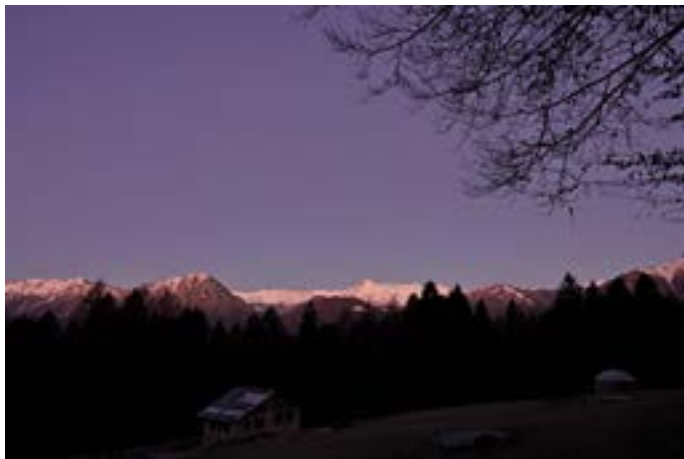
Der Blick von Naone auf das Adamellogebirge zeigte am Morgen des 27.12.2025 eine sensible Lichtsphäre.