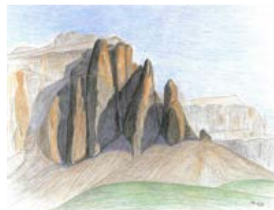
Die drei Sellatürme über dem Grödnertal.

Das Bergsteigen unterstützt in einfachen Formen die Gesundheit und entwickelt ein natürliches Bewegungsleben. Eine einfache Vorstellungsübung wäre es außerdem, die Konturen der Türme zu studieren und dann mental nachzuskizzieren, damit die Formkräfte im Menschen besser zur Entfaltung kommen. Die Berge selbst und die Auseinandersetzung mit ihnen steigern die Formbildekkräfte.