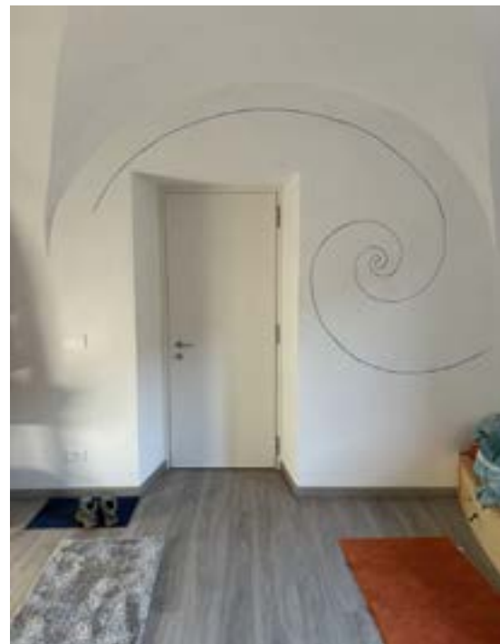
Eingang für das Gesundheitshaus in Lundo. In diesem Gebäude werden Hyperthermien und andere dem Krebs entgegenwirkende Maßnahmen eingesetzt. Die Spirale zeigt eine lebendige Bewegung, die sich mit dem Gewölbe harmonisch verbindet.

Sehr belastend wirken die vielen Suggestionen, die auf den Menschen geworfen werden. Sie bilden eine Art Energieverschiebung. Das Mediensystem und allgemein das politische System ernähren sich auf Kosten des Volkes. Die Menschen lassen sehr viel Kraft für die verschiedenen, vollkommen ineffizient gewordenen Sys-