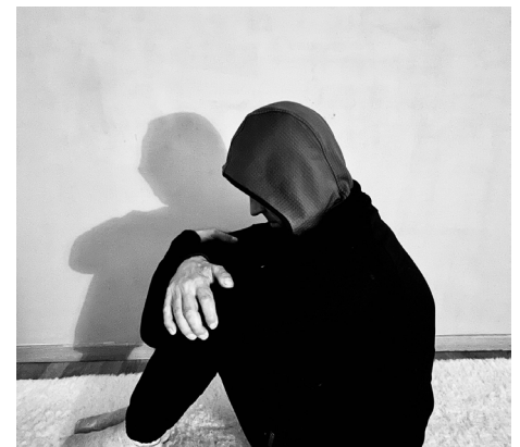
Ahriman lebt stark in seiner eigenen Körperlichkeit.