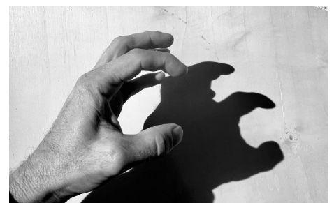
Ahriman ergreift immer den anderen, er kann den anderen nicht in Ruhe lassen.