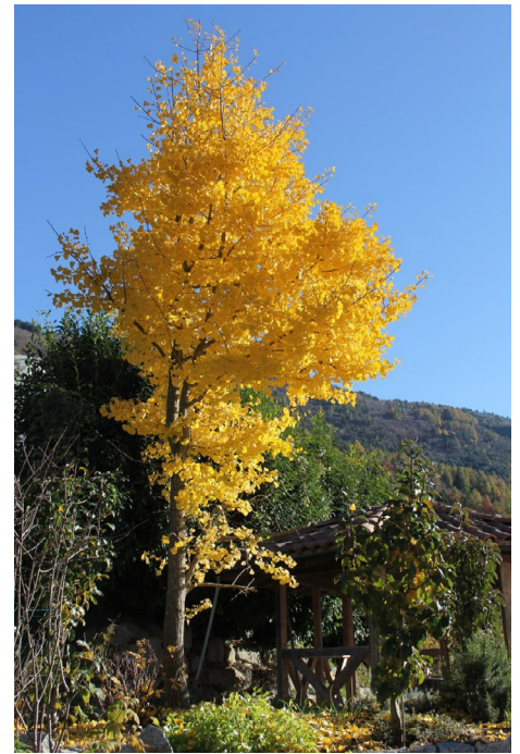
Ginkgo-Baum im Herbst. An die Natur kommt Ahriman nicht heran, in den Menschen und seinen Trieben kann er jedoch Einzug finden.

Wo lebt nun wirklich die ahrimanische Wesenheit? Welcher Mechanismen bedient sie sich, um an den Menschen heranzutreten und ihn in sein Höhlendasein zu stürzen? Eine sorgfältige Beschreibung und Analyse der psychischen Verhältnisse, in denen sich das Bewusstsein mit allen Anteilen des Untergründigen bewegt, ist für diese Betrachtung notwendig. Die Spekulationen, die heute allgemein über die Erscheinung Ahrimans herrschen, bewirken eine Deformierung des Menschen, unauflösbare Polarisierungen und zuletzt sogar gewaltähnliche Reaktionsmuster. Die Anthroposophie setzt in diesem Sinne leider mehr Angst als wirkliche Aufklärung der tieferen Umstände und deren logischen Zusammenhänge frei. Die Angst, die sich bei den Anthroposophen und bei vielen anderen bereits bis in die Glieder hineingesetzt hat, generiert nach außen hin eine ganze Reihe von irrationalen Handlungsinitiativen, die zuletzt in ihrer gesamten Folgewirkung einen Umstand erzeugen, der jede Türe zu einer wesenhaften Erkenntnis und geistigen Wahrheit verschließt.