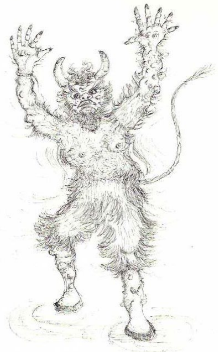
Es gibt aber des weiteren noch einen emotionalen Versucher. Zeichnung: Angelika Gigauri