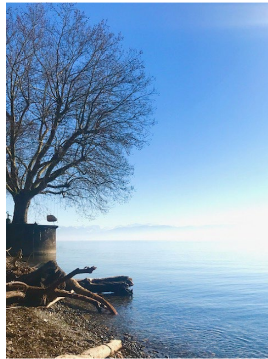
Eine Sphäre, die durch Aufmerksamkeit, Gedanken und Meditation gefördert wird.

Diese Geistverneinung trägt in der Folge schwere gesundheitliche Folgen, die nicht sofort bei jenem auftreten, der sich einem Pseudoglauben hingibt, sondern sich vielerlei verteilt in der ganzen Gesellschaft zeigen. 2025 wird das Jahr sein, das alles Geistige ins