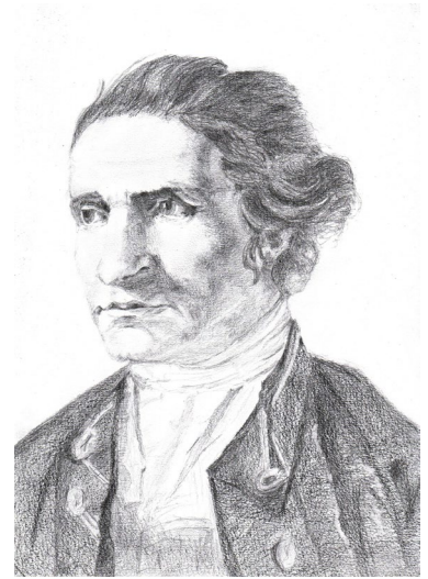
James Cook 1728 - 1779

Eine Fähigkeit, die gerade in der Entwicklung neuer Gedanken und deren