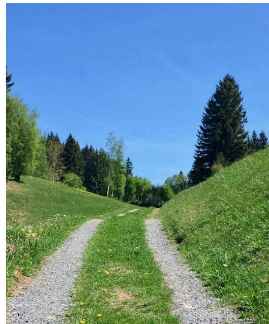
„Ich habe das Gefühl, dass ich auf dem richtigen Weg bin. Es ist mein Weg. Anderen kann ich helfen, da sie noch nicht ausreichend erwacht sind. Ich selbst bin in mein Inneres eingetreten. Ich helfe der Welt zu Frieden, während andere den Krieg generieren.“