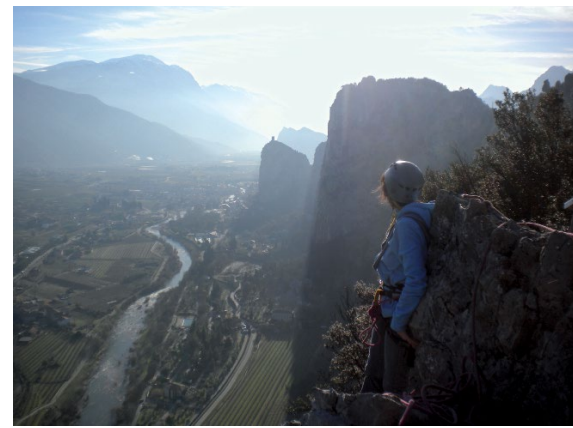
Die Kletterrouten in Sarcatal sind ein Beispiel für einen lebendigen Kulturbeitrag, der aus dieser schöpferischen und zugleich meditativen Arbeit entehen kann.

In der Regel sprechen Menschen von Telepathie, wenn in Kanada eine Person plötzlich jene Gedanken empfängt, die von einem Bekannten, der in Europa lebt, gedacht sind. Welche Prozesse in der Telepathie vorgehen, ist unbekannt und somit bleibt dieses Fachgebiet noch sehr unerforscht und rätselhaft. Es ist eine esoterische Betrachtung notwendig damit erfasst wird, wie Menschen in eine Verbindung kommen, die sich nicht begegnen und sich vielleicht gar nicht kennen, und dennoch auf stille Weise kommunizieren. Der Weg erfolgt über eine Instanz, die man heute nicht mehr gerne