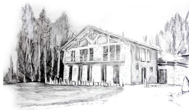
Die Bezeichnung Sonnenoase ergibt sich aus der Tatsache, dass der einzelne Mensch durch seine Bewusstseinsaktivität selbst zu einer sonnenhaften Ausstrahlung gelangen kann.