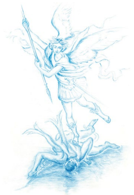
Dies Zeichnung zum Erzengel Michael von Raffael bringt die lichte Freiheit und Souverenität im Umgang mit dem Bösen zum Ausdruck.