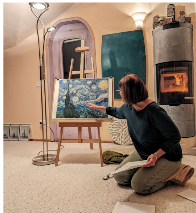
Die Kunst und Kunstvermittlung ist Teil der Arbeit an der Sonnenoase.