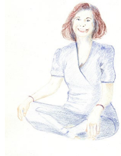
Das Medium lebt nicht in Beziehung sondern in einer eigenen Welt.

Die Analyse der Worte und eine meditative Betrachtung zur Frage, über welche Gefühle das Medium spricht, konnten sehr eindeutig eruiert werden. In den immer wiederkehrenden Wortschilderungen und Aufforderungen zu einem mehr gefühlsmäßigen Leben entdeckten alle eine Art Polarisierung. Auf der einen Seite stehen die niedrigfrequenten Personen, auf der anderen Seite die höherfrequenten. Die Höherfrequenten seien gerettet, die Glücklichen, sie seien die Bringer der neuen Zukunft. Eine große Freiheit lebe in den recht hochfrequent lebenden Personen, die aufgrund ihrer Gefühle erwacht seien und das Leben für die Zukunft im Sinne eines neuen Planes leisten. Außerirdische Sternenvölker, mit denen das Medium kommuniziert, treten in